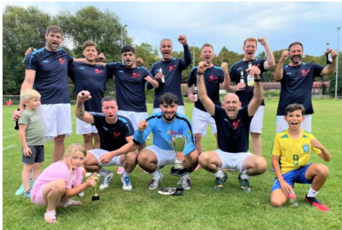
Eine sehr gemischte Airbus-Truppe von jungen Azubis bis ü50-Spielern gewann souverän das IG Metall-Fußballturnier 2025

Wir gehen davon aus, dass auch im nächsten Jahr wieder ein Fußballturnier der IG Metall Wesermarsch stattfindet. Hoffentlich auch mit weiteren Airbus-Mannschaften.