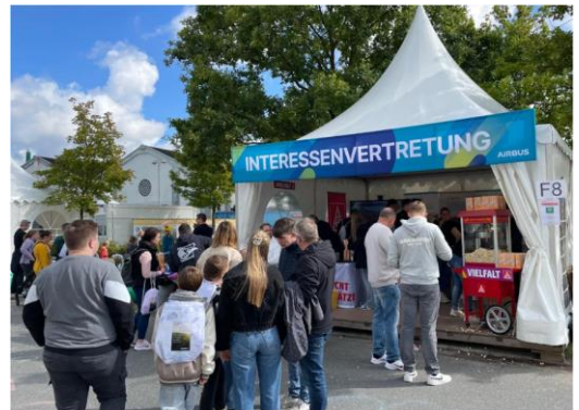
Unser Stand beim aktuellen Familientag 2025

Eine tolle Veranstaltung mit einem tollen Rahmenprogramm. Diese Veranstaltung hätte noch mehr Besucher verdient. Aus unserer Sicht hätte die analoge Werbung, die Erläuterung des Anmeldeprozesses sowie die Bekanntgabe des Programms früher und intensiver stattfinden können.