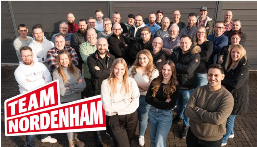
Am letzten Samstag: Toller Workshop mit vielen Kandidatinnen und Kandidaten

Eine Vorentscheidung für mögliche Aufgaben und Funktionen für den künftigen Betriebsrat ist damit nicht getroffen worden. Das haben nach der BR-Wahl die neugewählten Betriebsratsmitglieder zu entscheiden.