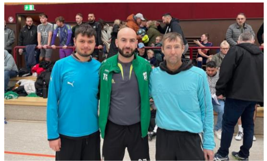
Unsere Schiedsrichter vom Hallenturnier 2025. Faire Spiele und gute Schiris gehören zusammen

Weiterhin sind wir noch auf der Suche nach freiwilligen Schiedsrichtern, denn ohne sie geht es nicht. Die Schiris erhalten eine kleine Aufwandsentschädigung für ihren Einsatz.